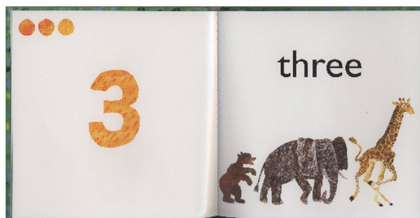
© 1989, 1968 by Eric Carle LLC

El 123 de Eric Carle es un libro para aprender a contar. En cada página aparece un nuevo animal mientras contamos del uno al 10. Cada página también incluye puntos que corresponden a la cantidad de animales.