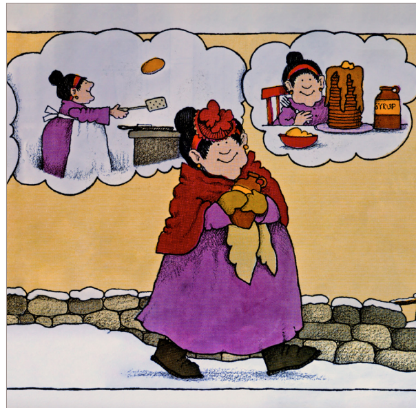
Copyright © 1978 by Tomie dePaola